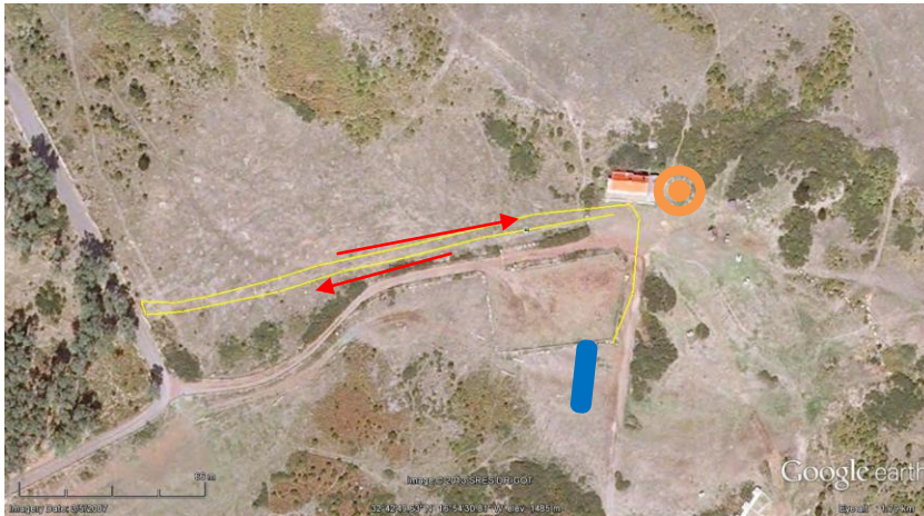
(1º Segmento – 1 volta)