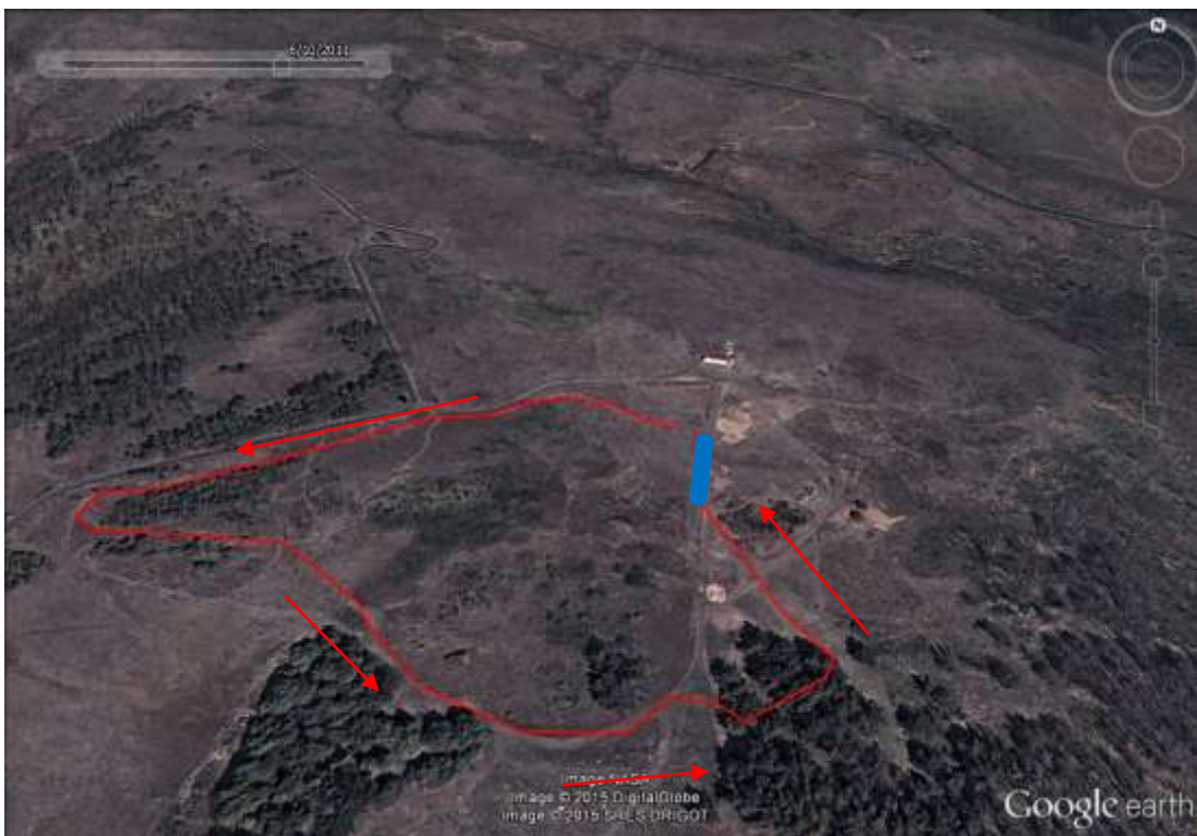
Segmento: BTT (950metros x 3 voltas = 2850m)