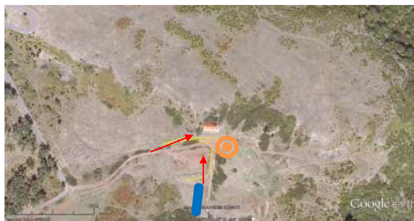
(3º Segmento: Corrida – 1 volta).