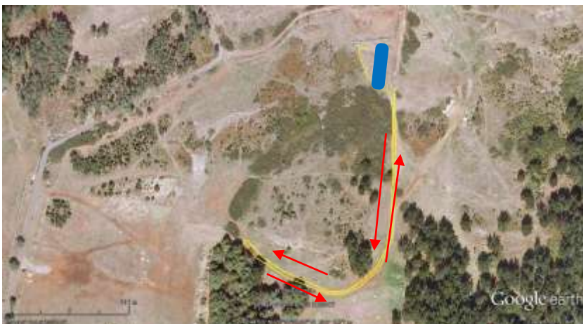
(2º Segmento – 1 volta)