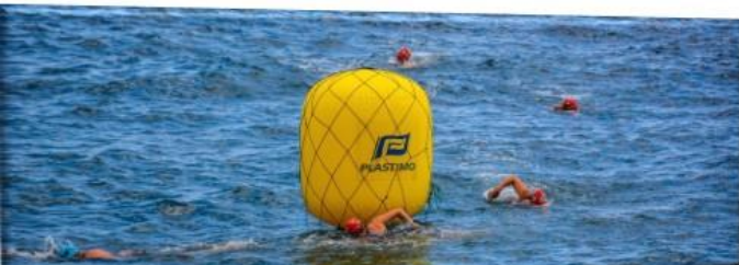
Sede Bombeiros Municipais de Machico