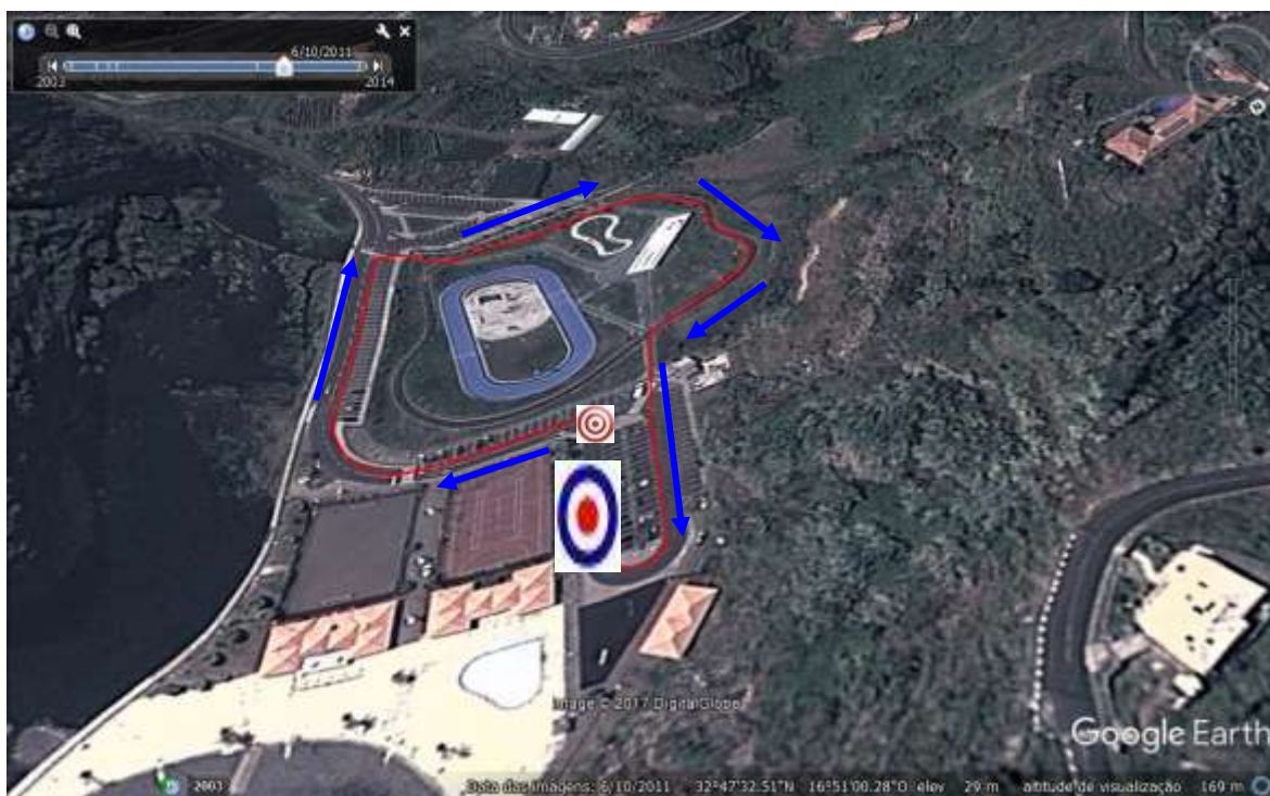
2º Segmento Infantis: Ciclismo = 2000m (2v)