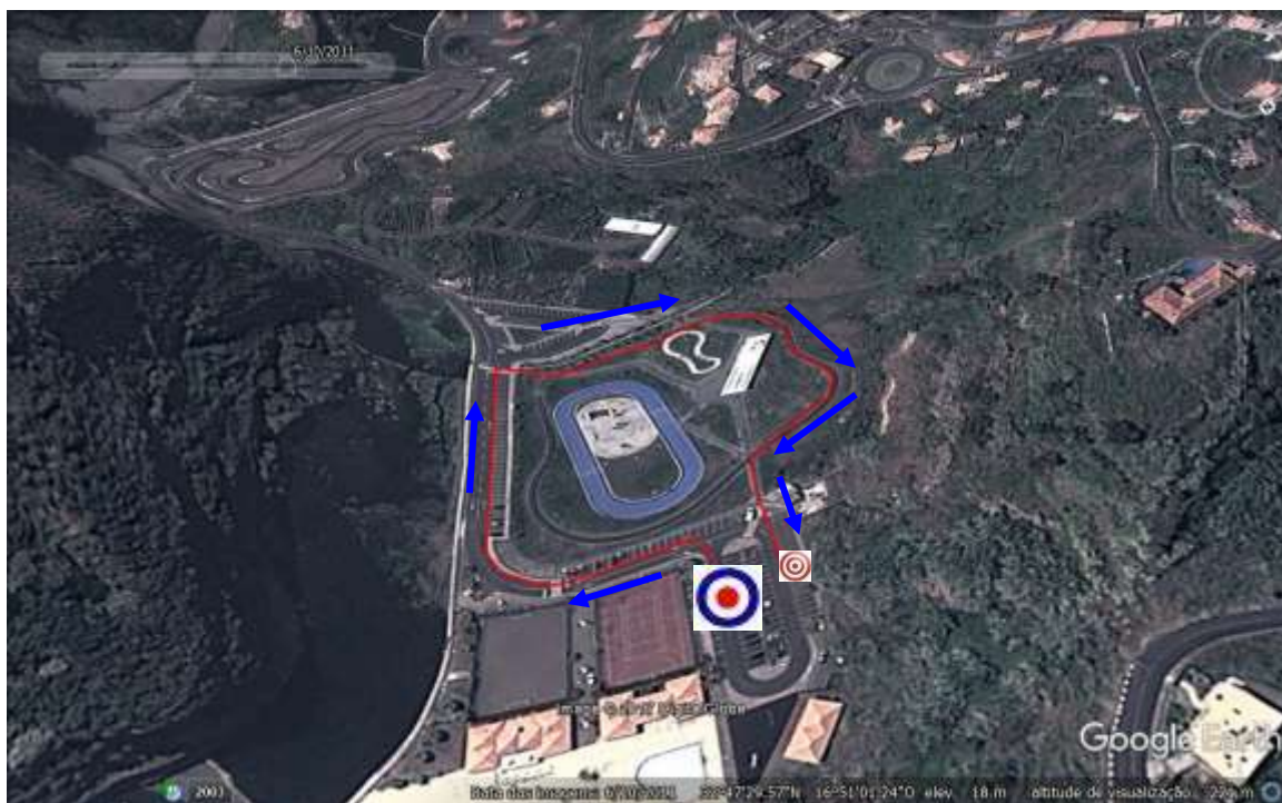
1º Segmento Infantis: Corrida = 550m (1v)