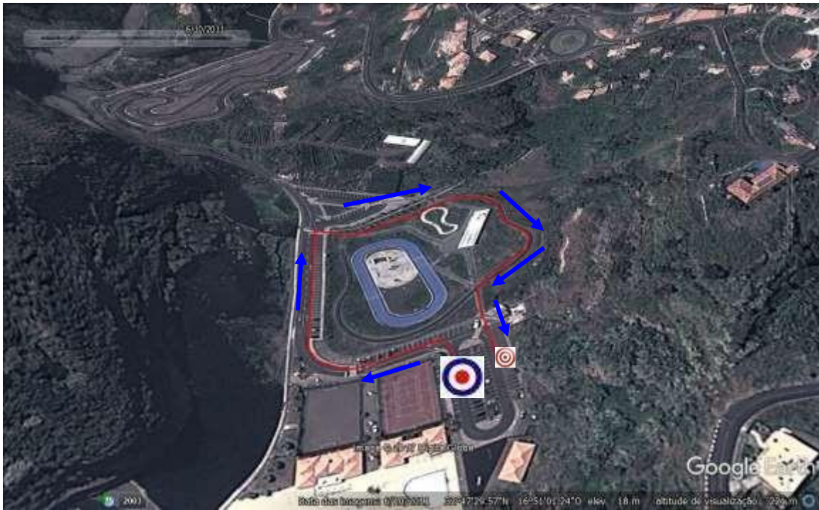
1º Segmento Infantis: Corrida = 550m (1v)