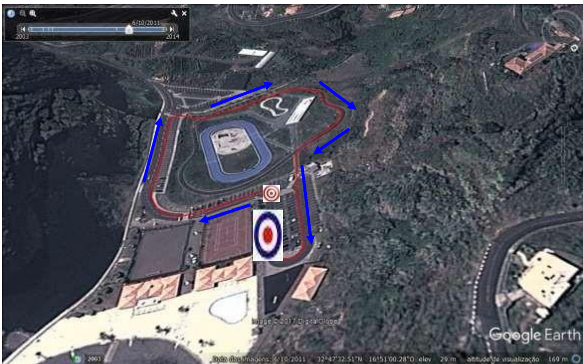
2º Segmento Infantis: Ciclismo = 2000m (2v)